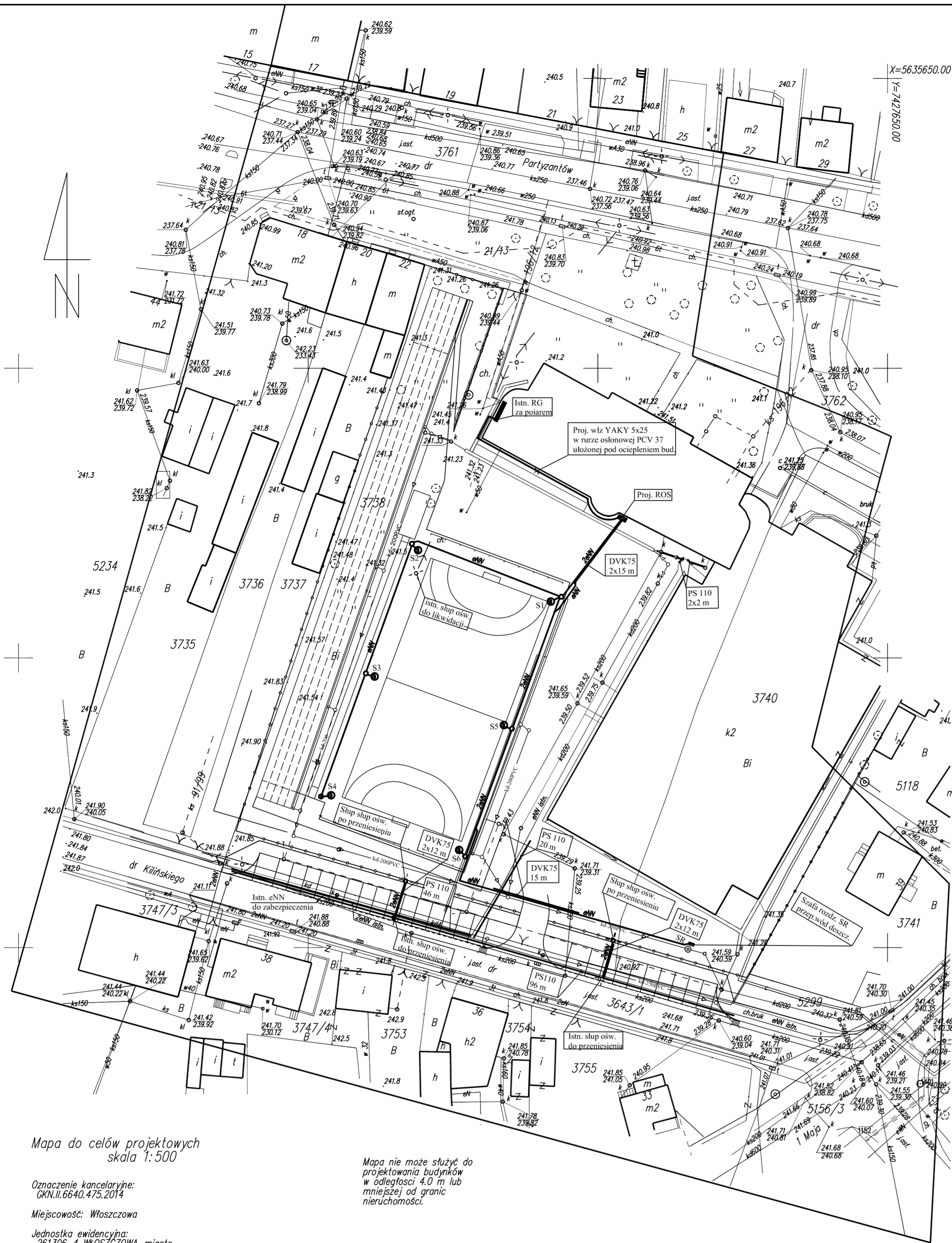
Mapa do celów projektowych skala 1:500

Oznaczenie kancelaryjne: GKN.II.6640.475.2014 Miejscowość: Włoszczowa Jednostka ewidencyjna: 261306_4 WŁOSZCZOWA-miasto Obręb: 5 OBREB 05 Działka nr: 3738,3739,3740,3643/1